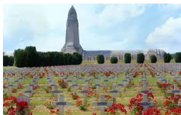
L'Ossuaire de DOUMONT