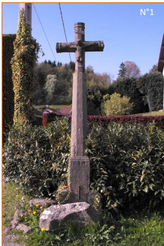
Croix N°1 de la rue Haute.

Haute de 3,20 mètres, elle date de 1684. Le fût est tronconique et repose sur un socle carré. Au pied du fût quatre vases comportant des lys sont sculptés. Le Christ a les jambes brisées. On distingue le coup de lance sur son flanc droit. La pierre est en grès blanc.