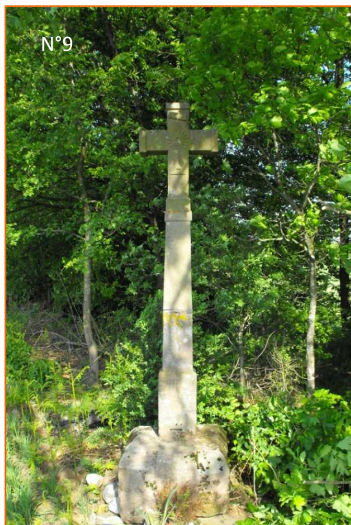
Croix N° 9